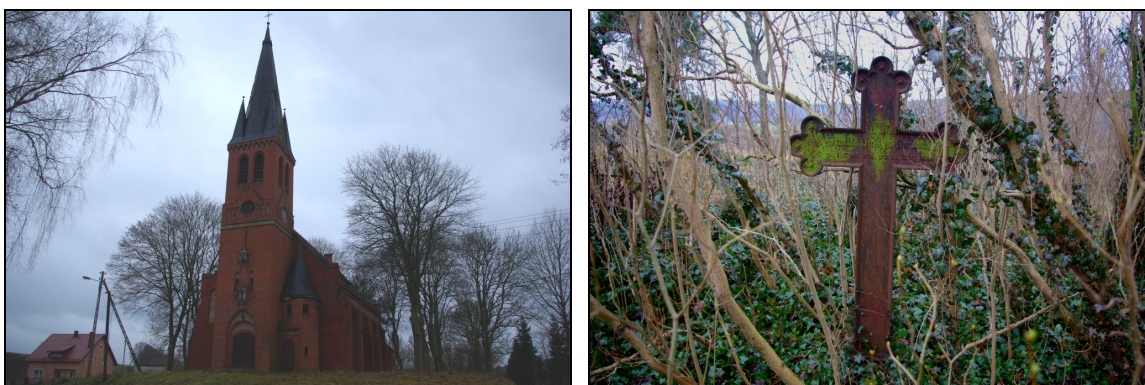
Fot. 37-38. Kościół ewangelicki i cmentarz przykościelny w Pogódkach