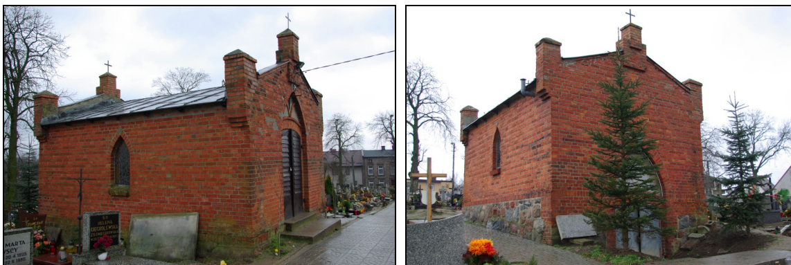
Fot.5-6. Kaplica cmentarna