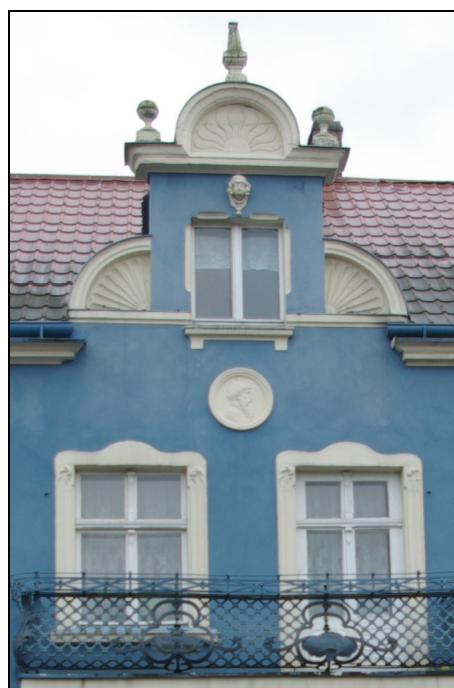
Fot. 17-18. Dom przy Placu Gen. Hallera nr 13