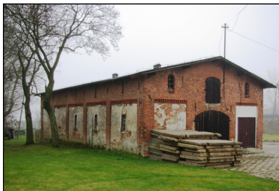
Fot. 23-26. Zespół dworsko-parkowy z folwarkiem w Bączku