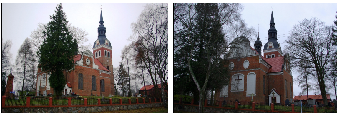
Fot. 35-36. Kościół p.w. śś. Apostołów Piotra i Pawła w Pogódkach

Kościół ewangelicki został zbudowany w 1899 r. w stylu neogotyckim z cegły. Jest to świątynia jednonawowa z prezbiterium zamkniętym trójbocznie. Obecnie jest nieużytkowany. Wokół kościoła znajdują się pozostałości po cmentarzu przykościelnym z nagrobkami datowanymi na koniec XIX w. i początek XX w.