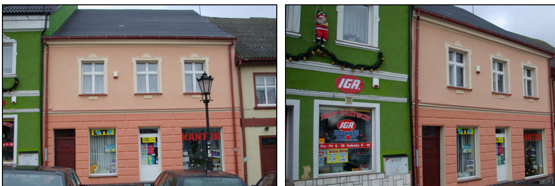
Fot. 7-8. Dom przy Placu Gen. Hallera nr 8