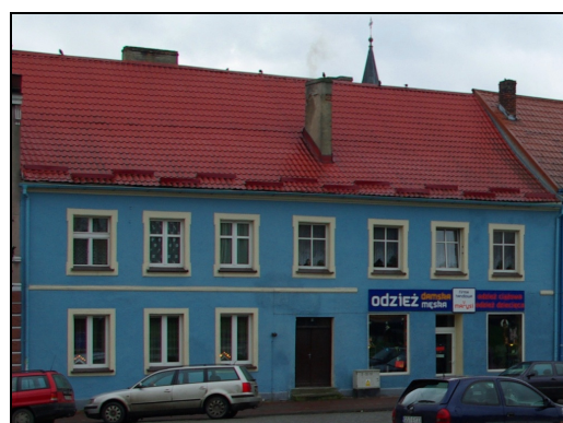
Fot. 15-16. Dom przy Placu Gen. Hallera nr 12