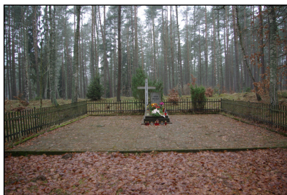
Fot. 21-22. Cmentarz żydowski