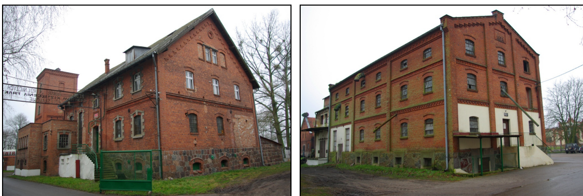
Fot. 27-30. Zespół dworsko-parkowy z folwarkiem w Bolesławowie