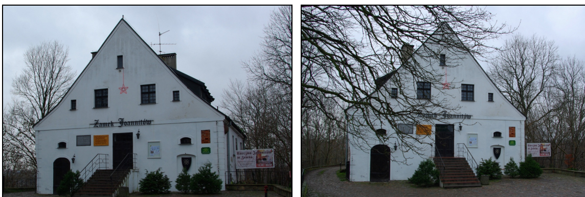
Fot. 5-6. Zamek Joannitów