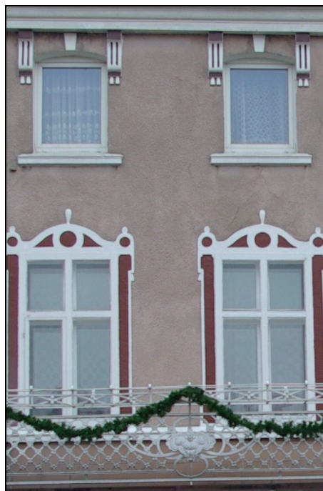
Fot. 13-14. Dom przy Placu Gen. Hallera nr 11

Dom nr 12 został zbudowany na początku XX wieku. Jest murowany z cegły, dwukondygnacyjny z dachem dwuspadzistym.