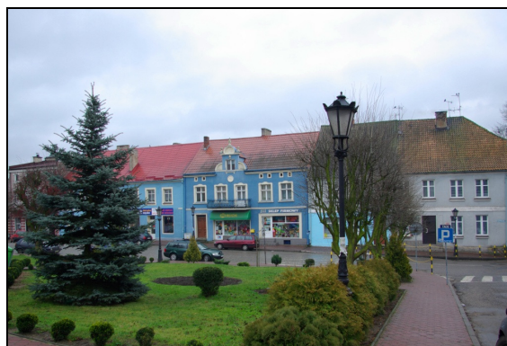
Fot. 19-20. Dom przy Placu Gen. Hallera nr 14 i 15