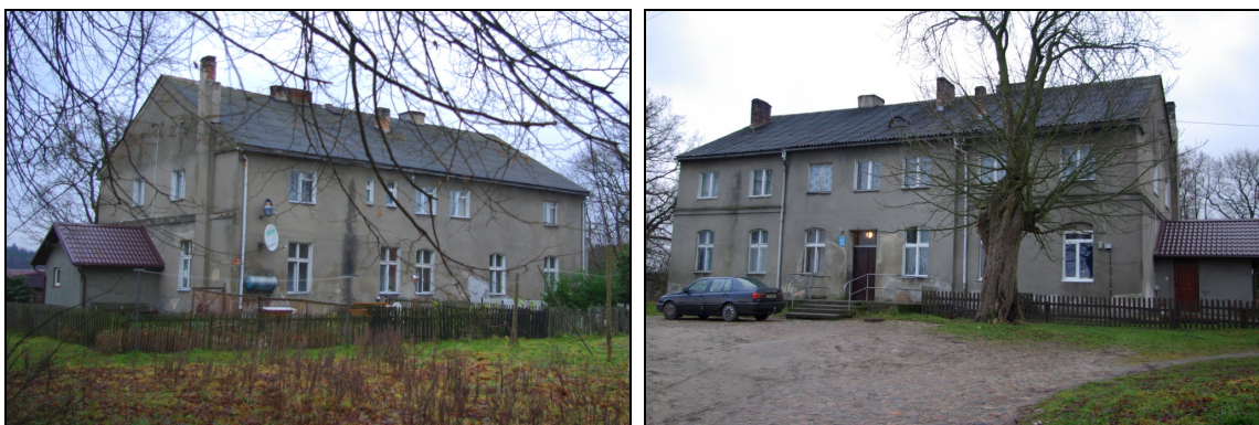
Fot. 39-40. Dwór w Pogódkach