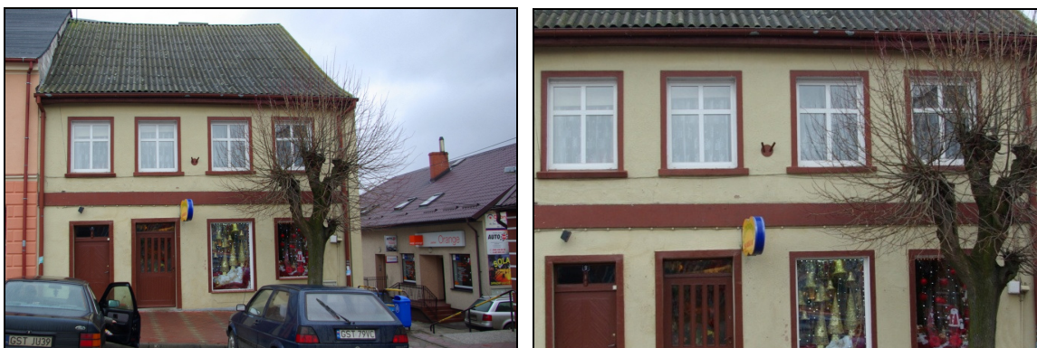
Fot. 9-10. Dom przy Placu Gen. Hallera nr 9