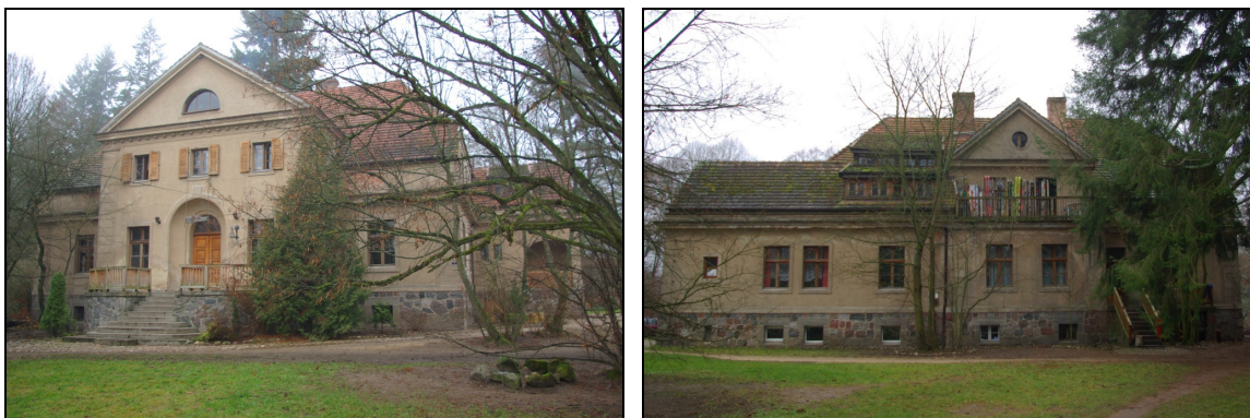
Fot.43-44. Dwór w Zapowiedniku