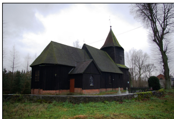
Fot. 41-42. Kościół p.w. śś. Apostołów Szymona i Judy Tadeusza w Szczodrowie