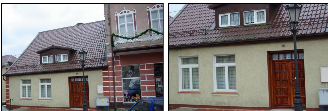
Fot. 11-12. Dom przy Placu Gen. Hallera nr 10

Dom nr 11 został zbudowany ok. 1900 r. Później nadbudowano drugie piętro. Budynek w przyziemiu jest boniowany, a okna wyższych kondygnacji posiadają opaski z dekoracją geometryczną. Drzwi do sklepu i części mieszkalnej wykonano techniką snycerską z dekoracją geometryczną. Na piętrze znajduje się balkon z ażurową balustradą.