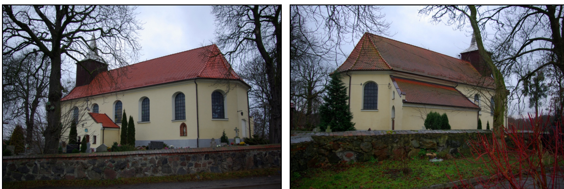
Fot. 31-32. Kościół p.w. Św. Jana Nepomucena w Godziszewie