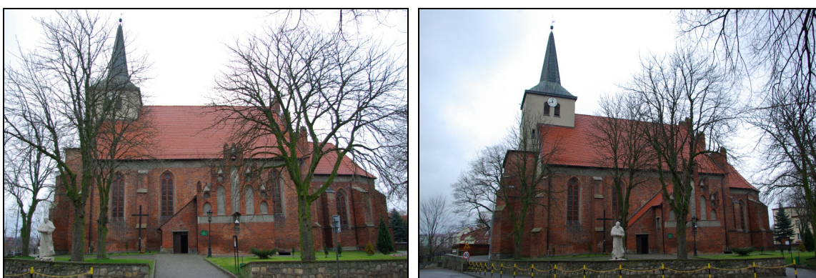
Fot.3-4. Kościół parafialny p.w. św. Michała Archanioła