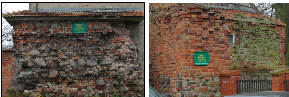
Fot.1-2 Pozostałość po obwarowaniach średniowiecznych miasta