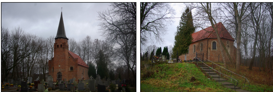
Fot. 33-34. Kościół p.w. św. Michała Archanioła w Obozynie