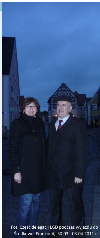
Fot. Część delegacji LGD podczas wyjazdu do Środkowej Frankonii, 30.03 - 03.04.2011 r.

Na zbliżające się Święta Wielkiej Nocy pogodnych i spokojnych świąt, zdrowia, radości i wiosennego nastroju w gronie rodziny