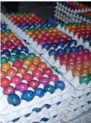
Przygotowania do Wielkanocy w Środka Frankonii

Złożenie wniosku o płatność za I etap funkcjonowania LGD - Urząd Marszałkowski, Gdańsk