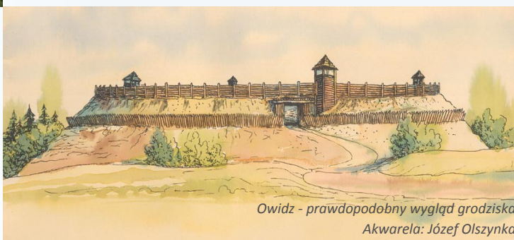
Owidz - prawdopodobny wygląd grodziska Akwarela: Józef Olszyna

Próbę rekonstrukcji grodziska w Owidzu umożliwiają wyniki badań archeologicznych prowadzonych w latach 1973-1979 oraz 2006 roku przez pracowników Muzeum Archeologicznego w Gdańsku.